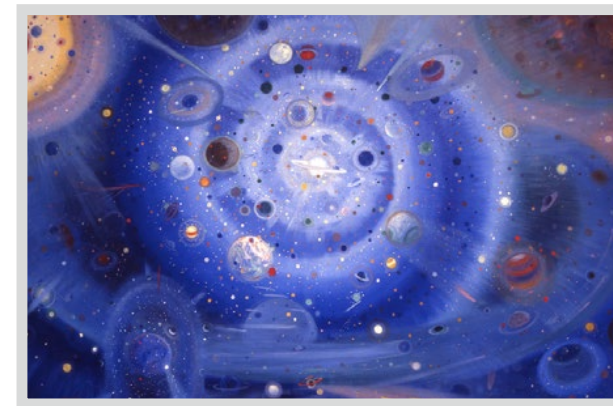
Wenzel Hablik, Sternenhimmel, 1913, Foto: Wenzel-Hablik-Stiftung, Itzehoe.