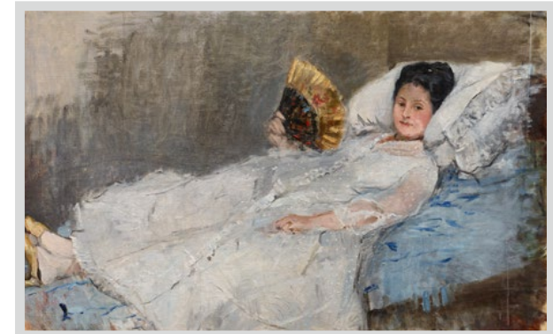
Berthe Morisot, Frau mit Fächer (Marie Hubbard), 1874, Ordrupgaard, Kopenhagen

Besuch mit Führung durch die Sonderausstellung